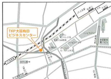
JR「大阪駅」・阪急「梅田駅」・阪神「梅田駅」・地下鉄四つ橋線「西梅田駅」の地下街を通り、6-2番出口を出てすぐ。 JR「福島駅」徒歩2分、阪神「福島駅」徒歩5分、JR東西線「新福島駅」徒歩5分。

開催日時：平成22年10月30日(土) 10:00～16:30(受付開始9:30より) 会場：TKP大阪梅田ビジネスセンター 16F(大阪市福島区福島5-4-21) 定員：100名 対象：地域において子育て支援活動を展開しているNPOの活動者・ボランティアスタッフや保育士、学生など子どもや子育て支援に関心のある方 参加費：無料 一時保育：無料(定員20名) ※要事前申し込み 主催：財団法人こども未来財団・NPO法人関西こども文化協会 後援：文部科学省、社会福祉法人全国社会福祉協議会、大阪府、大阪市、堺市、社会福祉法人大阪府社会福祉協議会、社会福祉法人大阪市社会福祉協議会、社会福祉法人堺市社会福祉協議会、大阪府教育委員会、大阪市教育委員会、堺市教育委員会