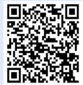
お申込みフォーム

上記申込み書に必要事項を記入しFAX、 もしくは右QRコードよりお申込みください。