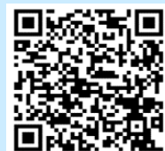
講座申込フォーム

※要申込み・連絡先、マスクなどの感染予防のご協力をお願いいたします。 飲み物の持込み自由。 状況により 延期・中止などになる場合があります。